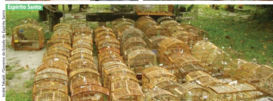
Apreensão de pássaros silvestres: grupo mais visado pelos traficantes, cuja atuação se estende por todo o Brasil

Apreendidas as aves, o primeiro problema está resolvido. Imediatamente depois vem o segundo, que é também o mais complicado: o que fazer com elas? Existem diversas possibilidades, que vão do extremo da eutanásia (sacrifício minimizando o sofrimento) até o da simples soltura, passando pela entrega feita por órgãos competentes a criadores autorizados ou pela doação a centros de pesquisa.