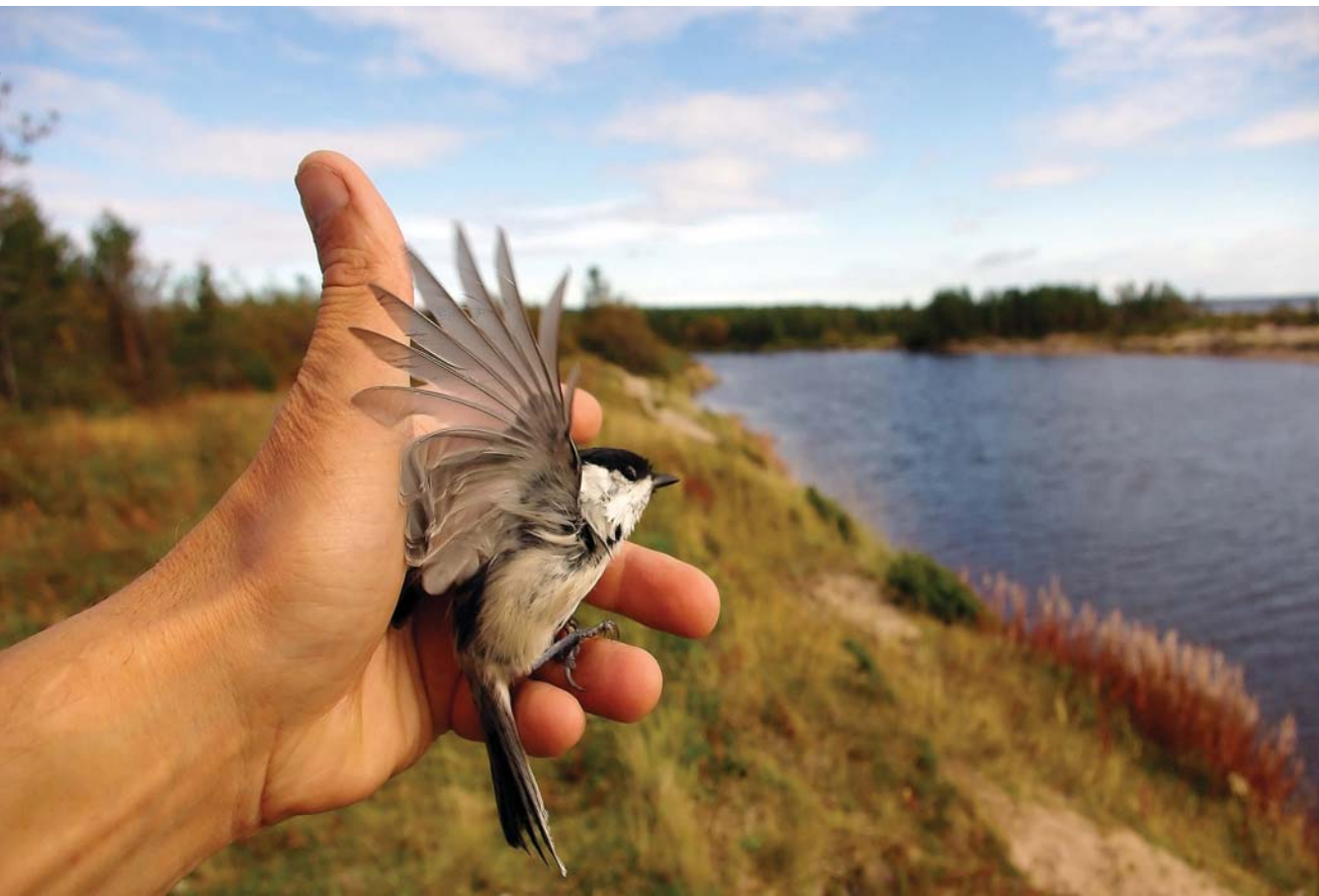
Soltura: vale a pena fazê-la quando o animal desconhece as fontes locais de alimento e abrigo?