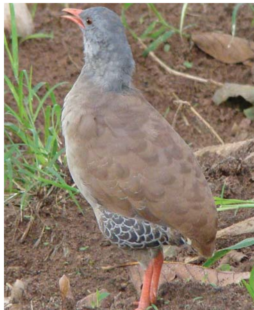
Xororó: Inhambu-Xororó ( C. parvirostris )