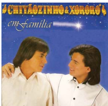
Os Inhambus Chitãozinho e Xororó: presentes em antigas capas de discos da famosa dupla sertaneja

Não por acaso, a canção deu nome a uma das duplas sertanejas mais conhecidas e populares de todo o Brasil: Chitãozinho e Xororó. O canto doce e melancólico com que essas aves se expressam foi bem emulado pela dupla. Em capas de seus discos e CDs antigos, vê-se, ao