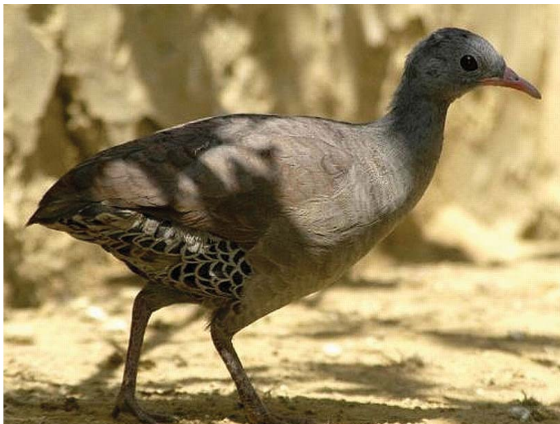
Chitãozinho: Inhambu-Xintã ( C. tataupa )

Com seu canto melodioso e melancólico, os tinamídeos - popularmente conhecidos como Inhambu, Perdiz, Macuco e Codorna - são parte importante do folclore e da cultura popular brasileira. Poucas pessoas tiveram oportunidade de observar essas aves na Natureza, apesar de muitas das suas espécies conseguirem sobreviver em ambientes degradados. Mas parte dos tinamídeos sofre com a caça e o desmatamento