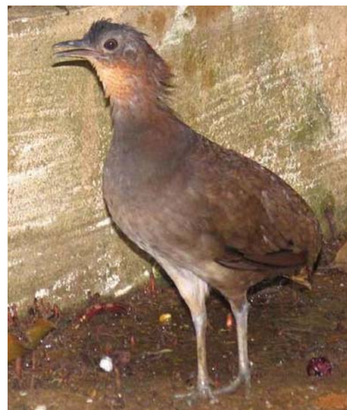
Inhambu-Relógio ( Crypturellus strigulosus )