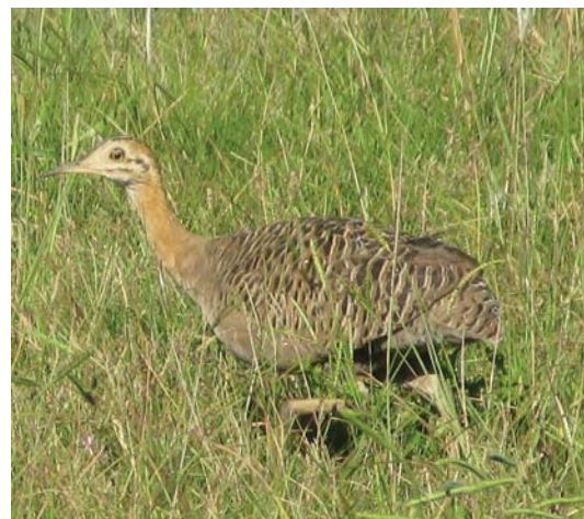
Perdiz ( Rhynchotus rufescens )