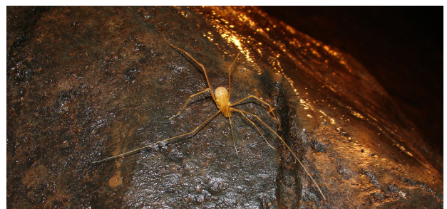
Figura 2. Opilião troglóbico, Iandumoema uai (Pachylinae), de Olhos d'Água, Minas Gerais.