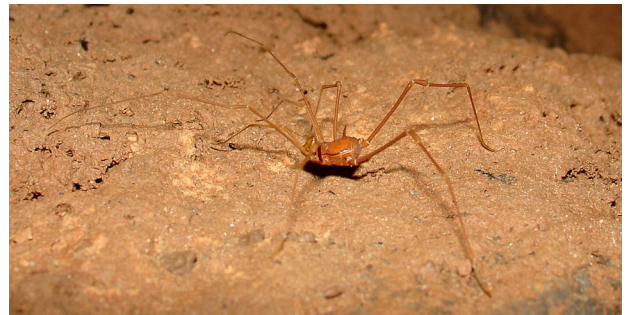
Figura 1. Opilião troglóbico, Eusarcus sp. (Pachylinae), da Serra do Ramalho na Bahia.

Os troglomorfismos vistos em aracnídeos não diferem muito do que é observado em outros artrópodes. Em ácaros, ocorre o alongamento e atenuação das quelíceras, pedipalpos, pernas, tricobótrios e ocorre redução ou perda de olhos, ao menos na família Rhagidiidae (Ducarme et al. , 2004); em ambliopígeos, aranhas, opiliões e Ricinulei, há casos descritos de redução ou perda de olhos e alongamento de apêndices (Cokendolpher e Enriquez, 2004; Kury e Pérez-González, 2008; Rahmadi et al. , 2010; Snowman et al. , 2010) (Figs. 1 e 2); em Palpigradi e pseudo-escorpiões, foi descrito o alongamento de apêndices (Harvey e Volschenk, 2007; Souza e Ferreira, 2010); em Schizomida, pode haver perda das manchas oclares (Humphreys et al. , 1989) e escorpiões exibem perda ou redução de ocelos, atenuação de pernas e pedipalpos e redução no número de dentes do pente (Prendini et al. , 2010). Diferenças na disposição das cerdas sensoriais entre troglóbios e epígeos também foram descritas em Palpigradi e